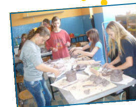
Pracovně-technická keramická dílna