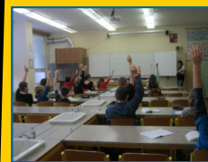
Učebna chemie, fyziky

Sleduji pozorně pohádky a pořady pro děti a vyprávím si o nich s rodiči. 10