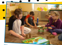
Tvořivé aktivity žáků

Meteorostanice pro práci žáků při terénním výzkumu