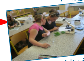
Badatelské aktivity žáků