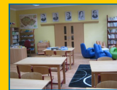
Žákovská knihovna ŠŠIC VŠEZNÁLEK