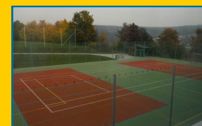
Nové multifunkční hřiště s umělým povrchem